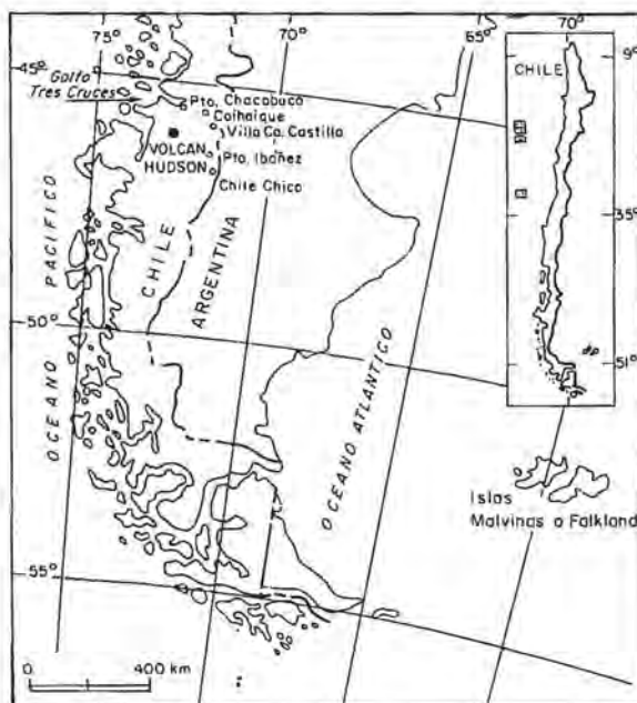
FIG. 1. Ubicación del volcán Hudson.

El 12 de Agosto, desde el nuevo centro, se produjo la segunda erupción paroxismal, que comenzó aproximadamente a las 12:00 horas. A las 14:30 horas se pudo observar, directamente desde un vuelo comercial Coihaique-Santiago, una columna