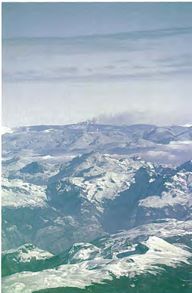
FIG. 3. Columna de explosión freato-magmática, correspondiente al inicio de la segunda fase eruptiva del volcán Hudson, 11 de Agosto. En primer plano, bloques de hielo de la avalancha que sobrepasó el cauce del río Huemules. Vista al ESE.